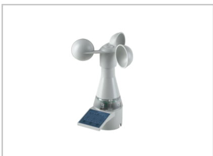
Wetterstation multisense 1002824