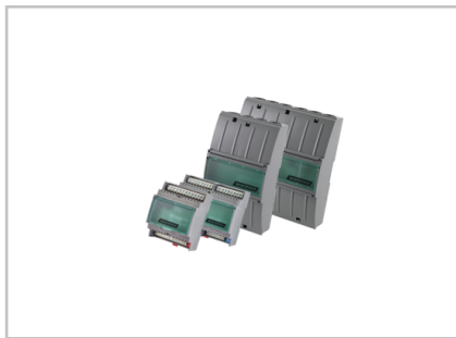
Motorsteuereinheiten für 230 V Antriebe