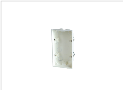
Hohlwandgehäuse UP (Wisotronic) 1002837