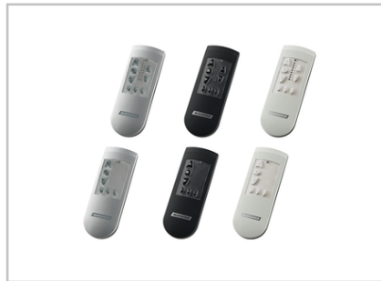
EWFS Handsender 1K/8K