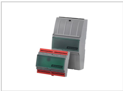
Motorsteuereinheiten für 24 V Antriebe