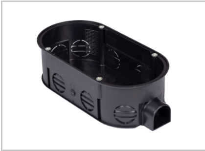
UP Doppelabzweigschaltdose schwarz