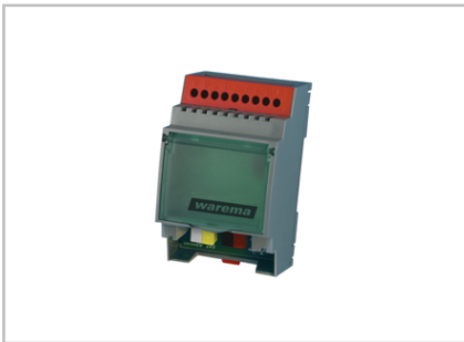
Sensor Splitter REG 2005604