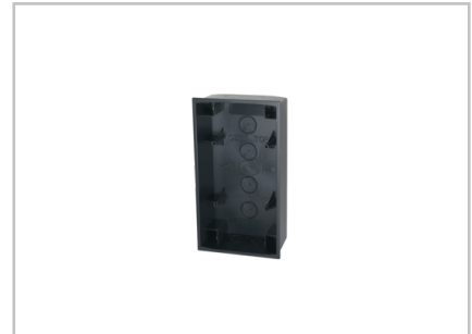
AP-Gehäuse schwarz (Wisotronic) 1002839