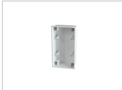
AP-Gehäuse weiß (Wisotronic) 1002838